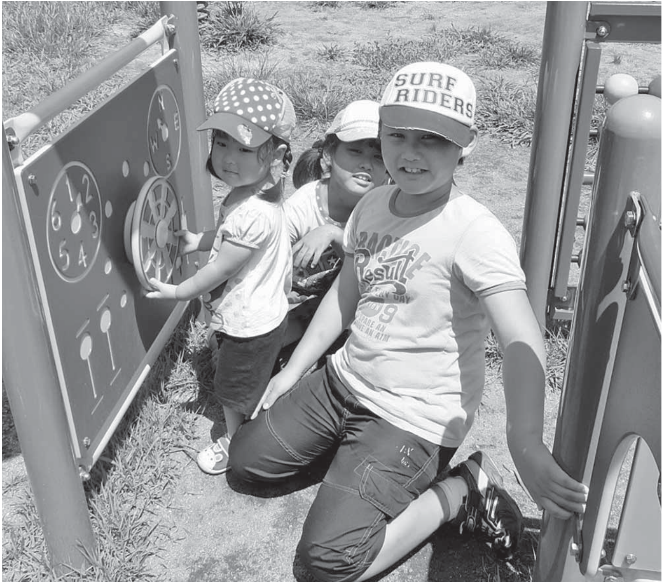
☆南城公園で休日を楽しむ子ども達☆

小諸市社会福祉協議会 小諸市八幡町 3-1-17 電話 25-7337 FAX 25-5332 E-mail:k-syakyo@ctknet.ne.jp URL:http://www.k-syakyo.org/